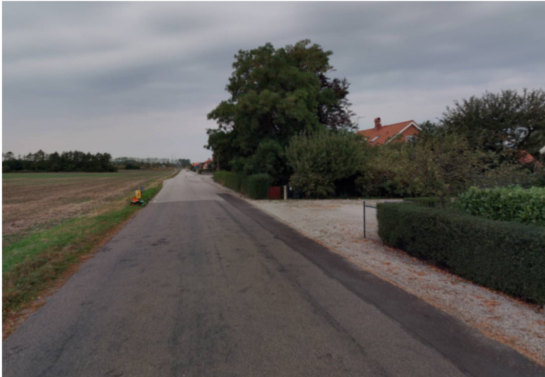
Figur 2. Vintrievägen sett österifrån.

Det finns inga aktuella hastighetsmätningar på platsen, men trafikdata från Tomtom visar en 85:e percentil runt 40 km/h. En mätning gällande trafikflöden på Vintrievägen visar ett medelvardagsdygn på 200 fordon, vilket förvaltningen bedömer som en låg mängd fordon på gatan.